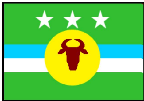
Bandera de Rosario de Perijá

El municipio Rosario de Perijá posee su propio himno, escudo y bandera. El himno ( Fundación , con letra y música de Reynaldo Reyes Navarro, y arreglos de Carlos Aarón Nava Romero) fue creado el 6 de agosto de 1997. La bandera fue diseñada el 5 de enero de 1995. El primer escudo fue creado el 10 de enero de 1990 5 .