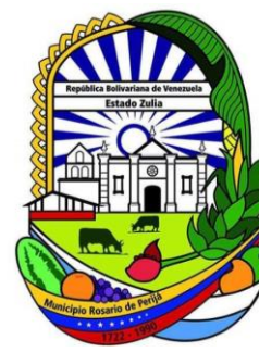
Escudo de Rosario de Perijá