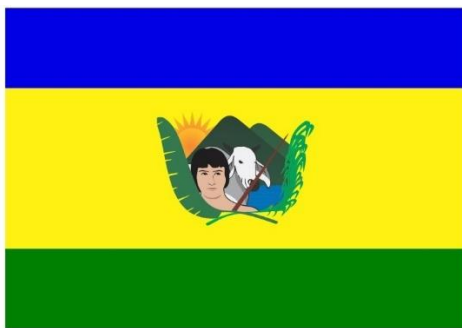
Bandera de Machiques de Perijá